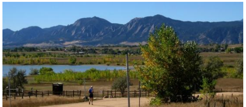
ボウルダー(イメージ)